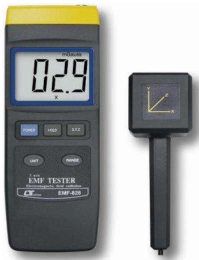
מכשיר לטרון EMF-828 עם גלאי חיצוני